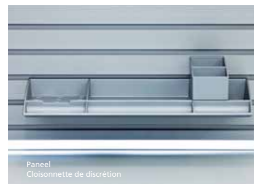
Paneel Cloisonnette de discrétion