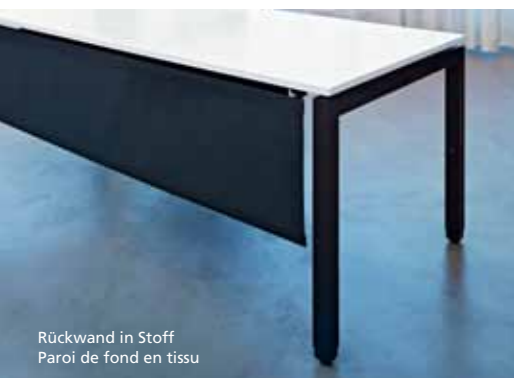
Rückwand in Stoff Paroi de fond en tissu