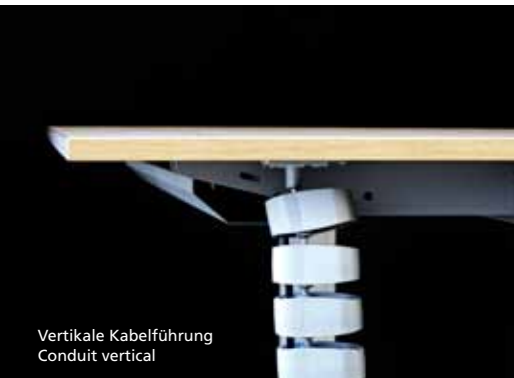
Vertikale Kabelführung Conduit vertical