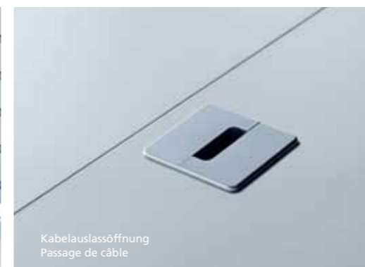
Kabelausschneidung Passage de câble