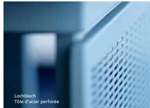
Lochblech Tôle d'acier perforée