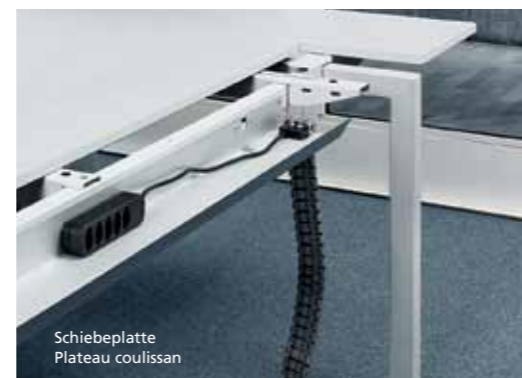
Schiebeplatte Plateau coulissant